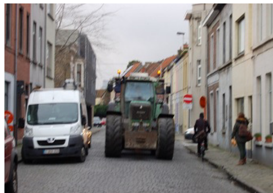
Nog zeker 10 jaar werk aan het St-Pietersstation

4) Woonstraat: waar (blz. 8) "de verblijfsfunctie zondermeer" primeert, daarom ook afgebakend als Zone 30 "om de woonfunctie daar te versterken" (blz. 18): alle overige straten in onze woonwijk.