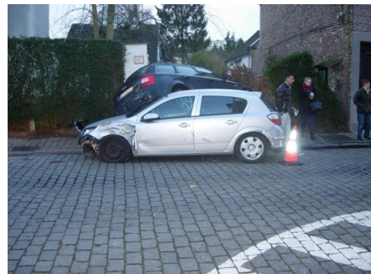
27 januari 2014: snelheidsduivel ramt 7 wagens in de Maaltebruggestr.